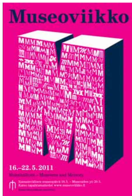
Museoviikon uudistetun julisteen saattoi ladata Museoliiton verkkosivuilta.

Näyttelypostilista on museoalasta kiinnostuneiden sähköpostipalvelu, ja se toimii Museopostin rinnakkaispalveluna. Näyttelypostista löytyvät museoiden näyttely- ja tapahtumatiedot. Vuoden 2011 lopussa palvelussa oli 523 jäsentä.