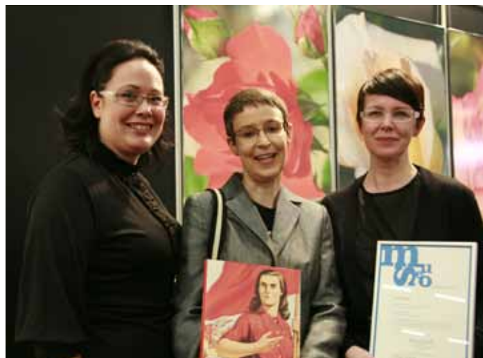
Turun taidemuseon julkaisu Punaste lippude all voitti Museojulkaisukilpailun.