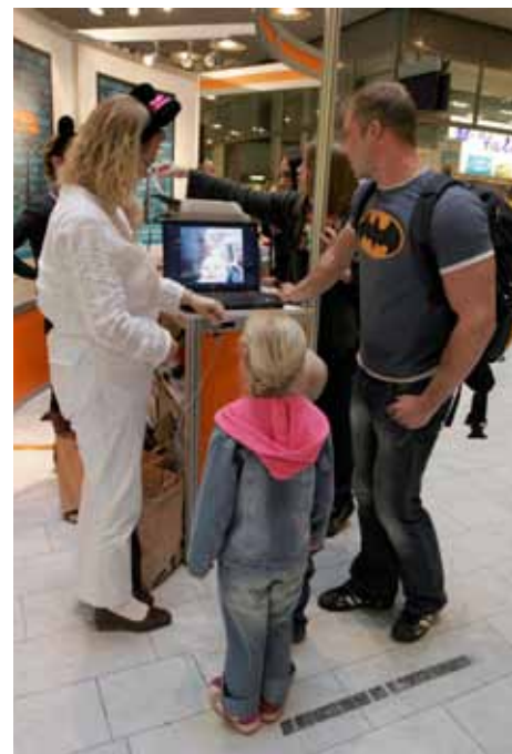
Museoviikon avajaisissa Kampin liikekeskuksessa museot ja suuri yleisö kohtasivat toisensa.