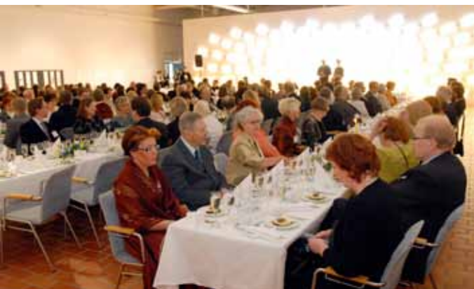
Illanvietto Satakunnan museossa.