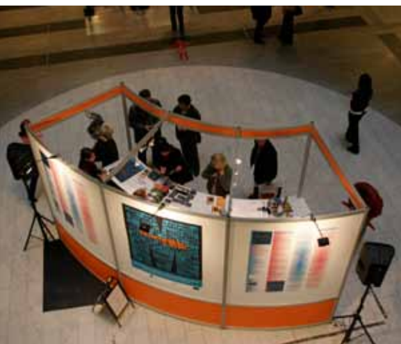
Museoliiton infopiste Kampin liikekeskuksessa.